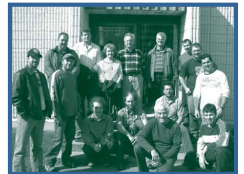
Les parrains et parrainés se rencontrent pour la première fois le 20 septembre au siège social du Syndicat et se préparent à la réalisation d'exercices de communication pour apprendre à se connaître. Chaque dyade est engagée dans une relation de parrainage pour les deux prochaines années.

La réalisation de cette initiative prévue au Projet de développement durable de la forêt privée du Bas-Saint-Laurent, est rendue possible grâce à la contribution du ministère des Ressources humaines et du Développement social Canada, par le biais de l'Initiative en matière de développement de compétences en milieu de travail. Les organismes suivants collaborent aussi avec le Syndicat des producteurs forestiers dans cette démarche : l'Association de la relève agricole du Bas-Saint-Laurent, les Centres locaux de développement des MRC suivantes : Rimouski-Neigette, Rivière-du-Loup, La Mitis, La Matapédia et du Témiscouata et la SADC de Rimouski-Neigette.