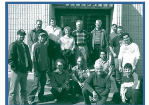
Les parrains et parrainés se rencontrent pour la première fois le 20 septembre au siège social du Syndicat et se préparent à la réalisation d'exercices de communication pour apprendre à se connaître. Chaque dyade est engagée dans une relation de parrainage pour les deux prochaines années.

La réalisation de cette initiative prévue au Projet de développement durable de la forêt privée du Bas-Saint-Laurent, est rendue possible grâce à la contribution du ministère des Ressources humaines et du Développement social Canada, par le biais de l'Initiative en matière de développement de compétences en milieu de travail. Les organismes suivants collaborent aussi avec le Syndicat des producteurs forestiers dans cette démarche : l'Association de la relève agricole du Bas-Saint-Laurent, les Centres locaux de développement des MRC suivantes : Rimouski-Neigette, Rivière-du-Loup, La Mitis, La Matapédia et du Témiscouata et la SADC de Rimouski-Neigette.